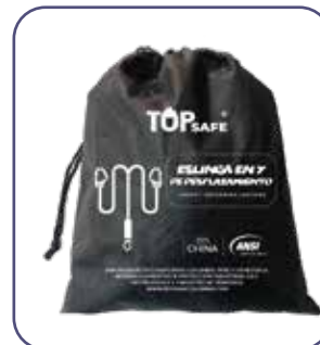
Gancho: ANSI Z359.12-19